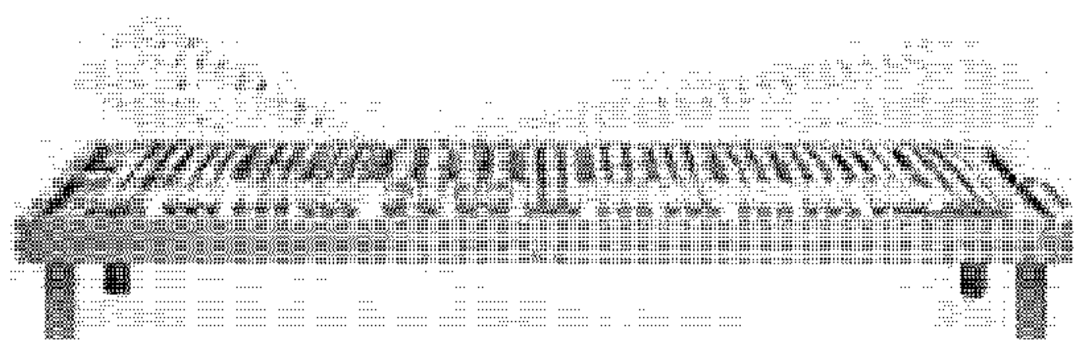
Somier articulable de la cama BioVital.